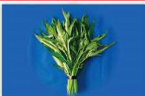
エンサイ(空心菜・ウチナーブー) の生茎葉