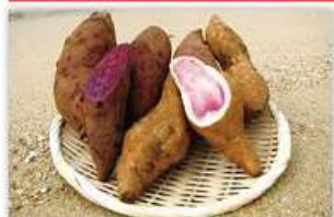
サツマイモ(紅イモなど) の生塊根